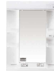
1面鏡 パルック蛍光灯タイプ。洗面ボールと調和したストレート形状です。