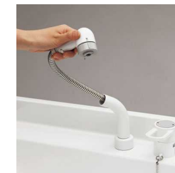
コンパクトで水はねしにくいシングルレバーシャワー。洗髪時はリフトアップでき、両手が使えます。