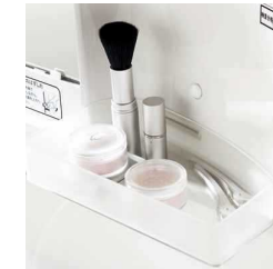
使いやすさにこだわったシンプルなデザイン。化粧小物などが置けるスタイリッシュなトレイです。