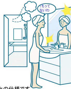
3面鏡の場合センターのみの仕様です。

電気代ゼロで、全面クリア。新感覚のミラーです。鏡の表面に、吸水性・親水性のある膜をコーティング。一部分しか効果のなかった従来品に対し、全面がくもらないため、お風呂上がりも鏡はいつもクリア。電気代もかからないので経済的です。