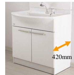
本体キャビネットは奥行き420mmのコンパクト設計です。