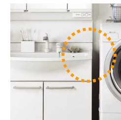
洗面ボールの成型精度が高いので、スッキリ納まります。