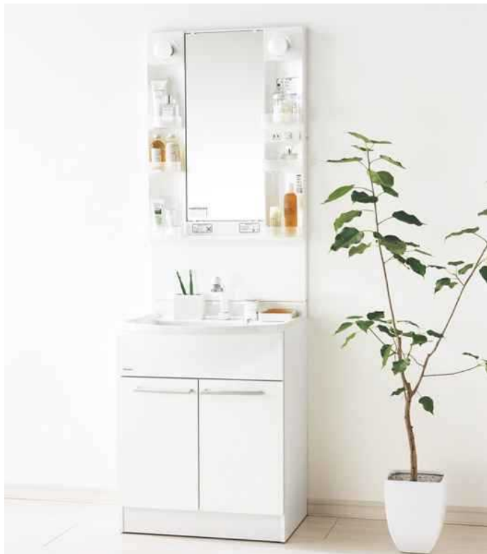
写真はイメージです。組合せ・サイズなどはお見積書をご確認ください。